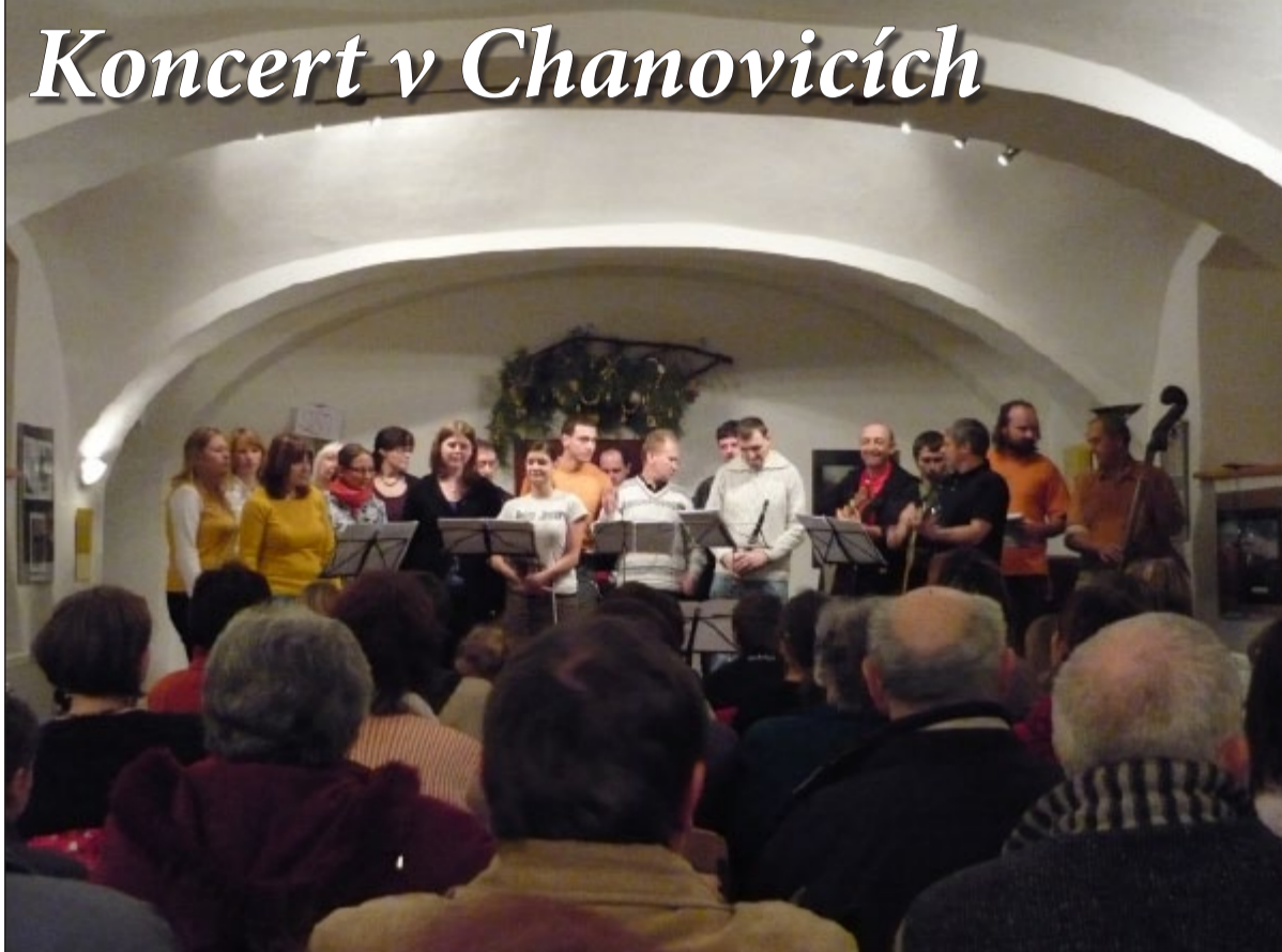
Volné sdružení horaždovických zpěváků a muzikantů vystoupilo o Vánocích v Chanovicích. Svým koncertem potěšilo opět mnoho lidí. Sdružení muzikantů u nás vystupuje už od roku 1991, první koncerty se konaly v kostele Povýšení svatého kříže. Jejich hudba a skladby jsou vždy srozumitelné pro všechny posluchače. VH

A Vánoce... pokud vám náhodou nezbude na velké vánoční dárky, věnujte se raději tradicím, pečte cukroví, bavte se s rodinou, rozjímejte o životě a přečtěte si něco z života našich předků. Spokojenost národa nikdy nebyla a nebude skryta ve vyrobeném množství HDP, ale v morální síle a charakteru jeho občanů. Vždyť naše osobní štěstí tkví v maličkostech, přátelství, vzájemné úctě, tělesném i duševním zdraví a množství času stráveného s těmi, které máme rádi. Zastavme se tedy v tomto adventním čase a v klidu si uijme trochu společného štěstí. MK