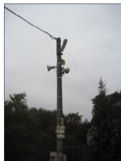
Co může vypovědět o obecním dění jeden sloup v Újezdě? Ze byl vybudován bezdrátový rozhlas. Ze byla vyměněna všechna svítidla veřejného osvětlení. A že zde prochází dvě turistické značené trasy.

V minulém čísle Panorámy jsem psal o odpadovém hospodářství. Dnes přináším několik čísel z účtů letošního roku. Celkové známé náklady na svoz, likvidaci a uložení odpadů z celé naší obce k poslednímu listopadu činí 696 168 Kč. Pří-